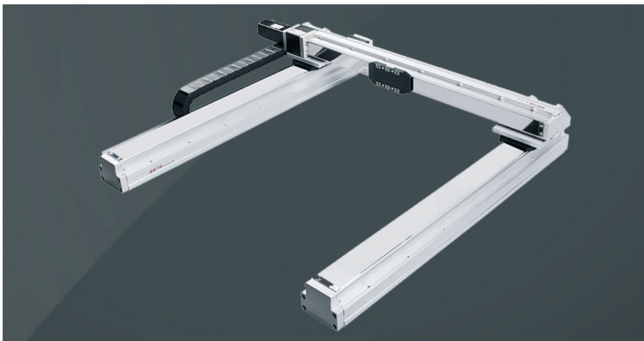
此图仅供参考, 出货规格详见尺寸图 The picture is just for the reference. Please check the actual dimensions on the drawing.